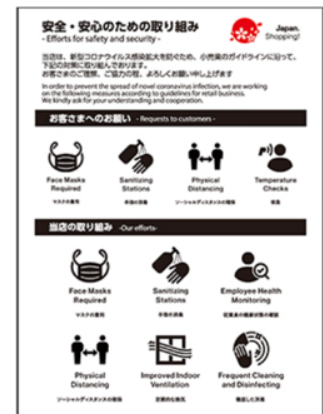
店舗入口での表示例

2020年オリンピック・パラリンピック大会に向けた多言語対応協議会小売プロジェクトチーム（以下「小売PT」という。）は、訪日ゲストに安全・安心にお買い物を楽しんでもらうために「安全・安心のための取り組み表示」を公開いたしました。