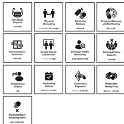
ピクトグラム（日英併記版）